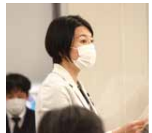
▲令和4年第1回定例会 総務委員会

A たとえば、都が発行する受理証明書を、 区市町村の住民サービス等で活用できるよう検討していただく など、連携を図る。具体的には、 都と都内全ての区市町村とで構成する性自認及び性的指向に関する施策推進連絡会等の場を活用するなど、丁寧に協議。