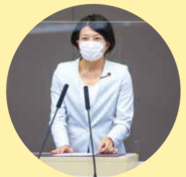
▲令和3年第2回臨時会にて